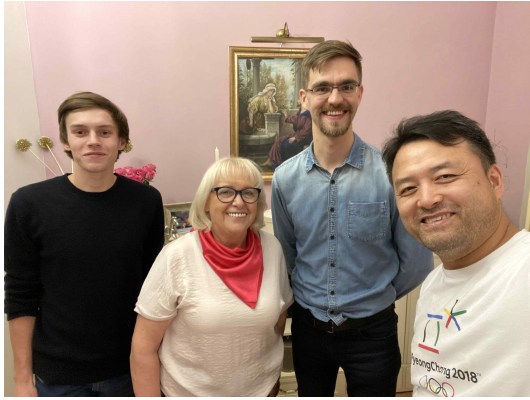
체코 첫 다락방(헬레나 방문)