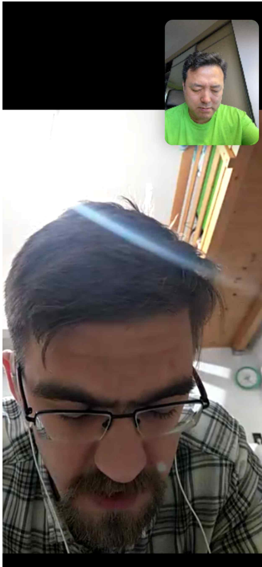
Zoom 화요 새벽기도회