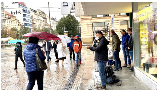
프라하 및 부르노 전도팀 연합 사역