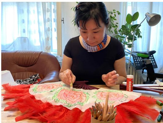
EEMF 문화사역(위십 부채 만들기)