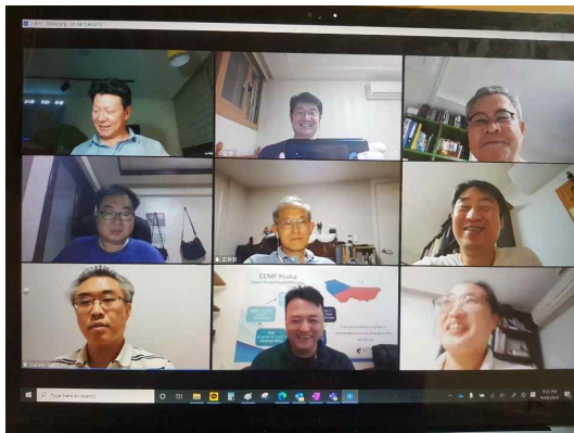
2012년 남제자반 화상 모임

서 김선교사와뽕는 마을과 도시에 하나님을 예배하는 자들이 일어나고 교회 가 세워지는 중보기도를 하다가 체코인들을 만나 교제하고 복음을 전할때 그 기쁨은 타문화권에 살아가는 외국인의 외로운 삶을 달래주기도 합니다. 저희 고향 시골 마을까지 서양 선교사들이 자전거타고 와서 말도 잘 통하지 않는데 복음을 전하고 교회를 세웠던 기억들이 새록 생각납니다.