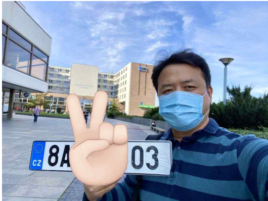
EEMF 차량 번호판 교체

니다. 이후 저도 계속되는 전도 사역을 위해 코로나 테스트를 받았는데 음성 판정을 받았습니다.