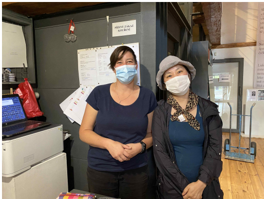
프라하 외곽 사역(하벨 박물관)