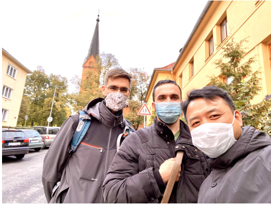
예수의 어부들 노방전도